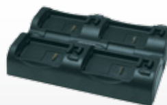
• Mehrfach Ladestationen