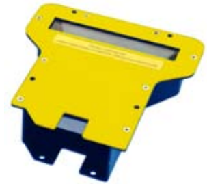
GFC-200 85° Umlenkspiegel